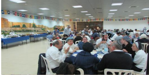
יום העצמאות תשע"ה