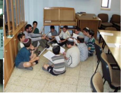
בתשעה באב עם הילדים...