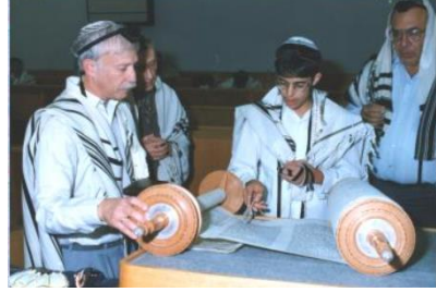
בר מצווה באדרת אליהו