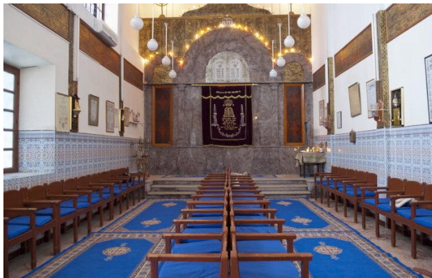
בית הכנסת צלאת אל עזמה

עד שנות ה-20 של המאה הקודמת, המלאח של מרקש היה הבית של הקהילה היהודית הגדולה ביותר במדינה שמנה עשרות בתי-ספר יהודים ובתי-כנסת. היא הייתה למרכז ללימוד התורה והקבלה. בה בשעה שיהודים במלאחים אחרים במרוקו סבלו מגלי אלימות ועוני, שפר גורלה של קהילת מרקש. במפקד אוכלוסין משנת 1947, יהודי מלאח מרקש מנו למעלה מ-50,000 נפש.