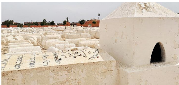
בית הקברות מיארה

אבן-חלדון (1332-1406) חכם איסלמי סוני של ימי הביניים כתב שמספר היהודים היה כה רב והשפעתם כה משמעותית ששבטים ברברים התגיירו בהמוניהם. מחקר עדכני יותר מצביע על מקורות הקהילה היהודית במהגרים/מבקרים מא"י.