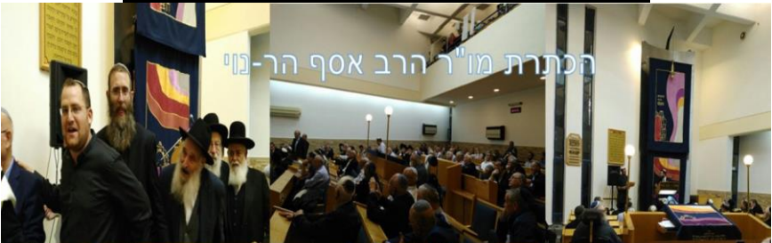
הכתרת מו"ר הרב אסף הר-נוי