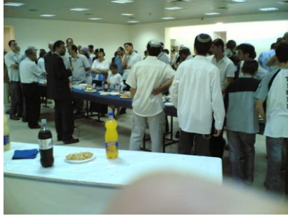
יום העצמאות תשס"ו