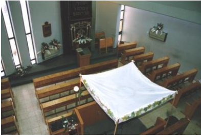
חתונה באדרת אליהו