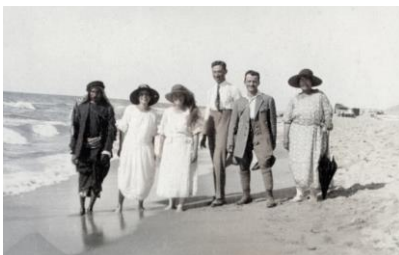
חוף עזה - 1924